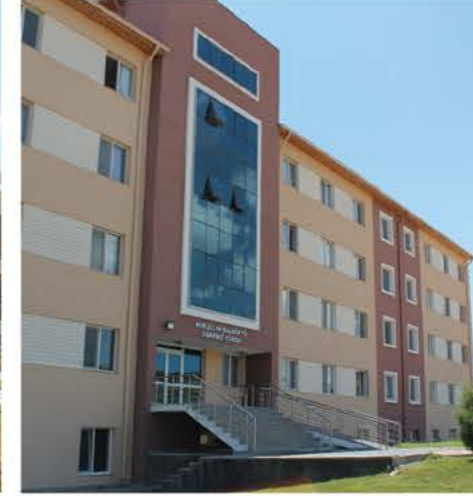
Kız Öğrenci Yurdu