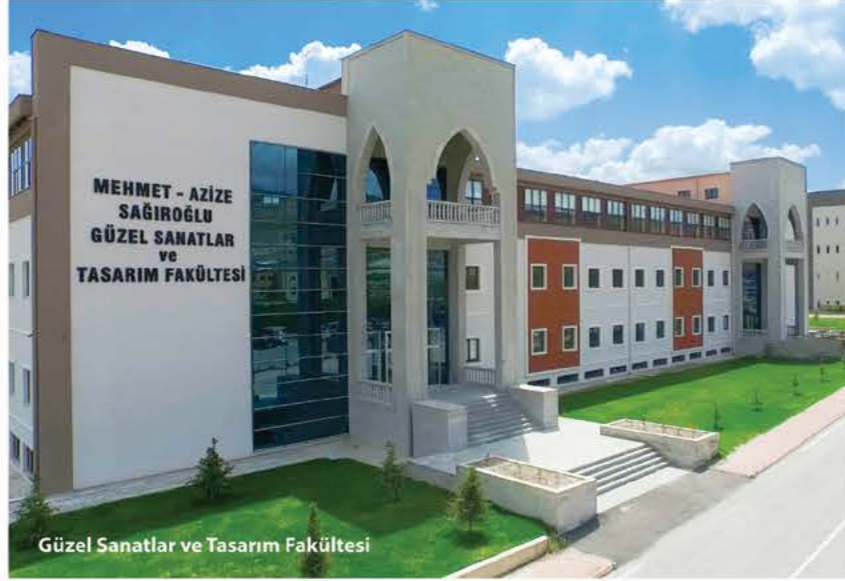
Güzel Sanatlar ve Tasarım Fakültesi