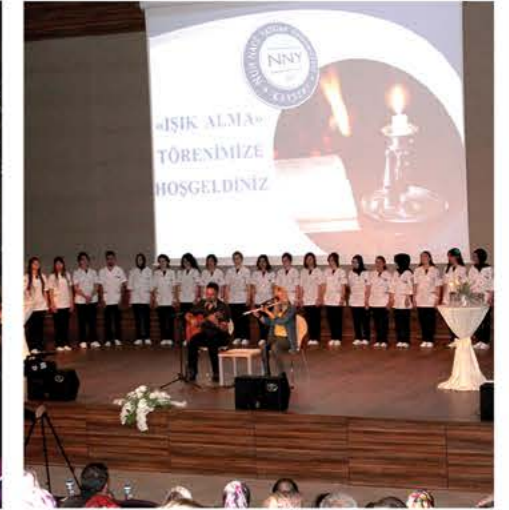
Işık Alma Töreni