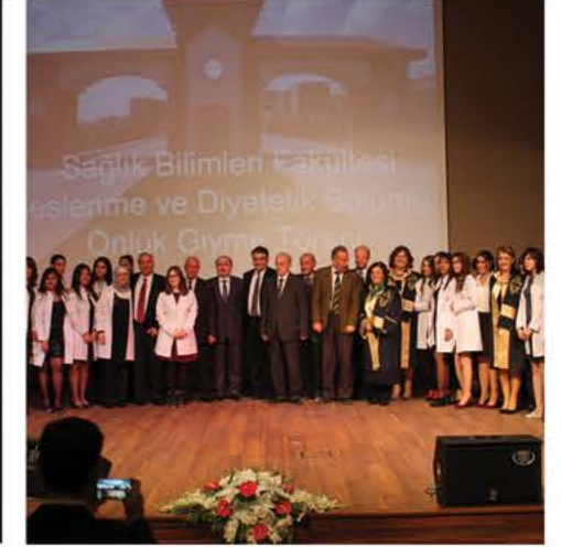
Beyaz Önük Giyme Töreni