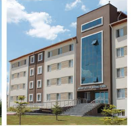
Erkek Öğrenci Yurdu