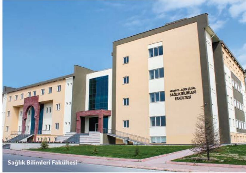
Sağlık Bilimleri Fakültesi

Ülkemizde diyetisyen olarak mezun olan kişi sayısının ülke gereksinimi açısından yetersiz olması nedeniyle Bölümümüzden mezun olacak öğrencilerin, mezuniyet sonrasında kolay iş bulma ve aranılır eleman olma olanakları yüksektir.