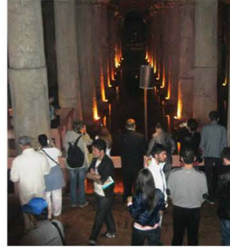
İstanbul Gezisi (Yerebatan Sarnıcı)