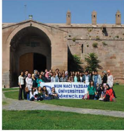
Kayseri (İncesu) Gezisi